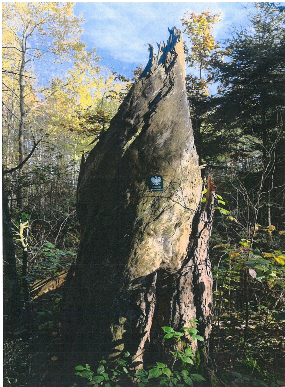
Zdj. Wykonane 6 listopada 2023 r.